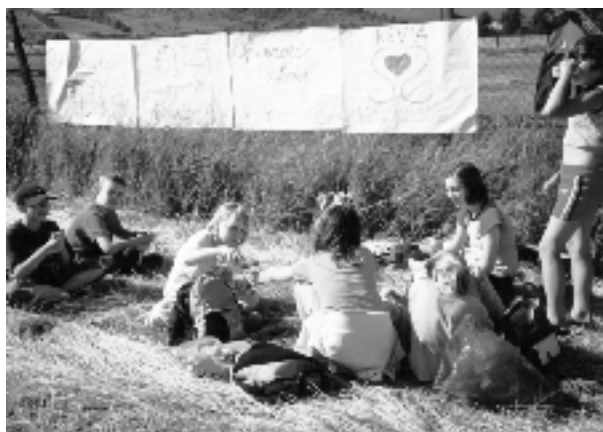
Memoriál Kupeckého, Pezinok 2004