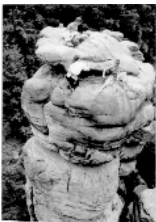
Športový klub Malé Karpaty, Modra