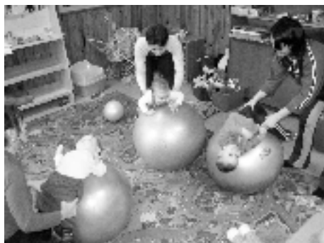
Materské centrum Modráčik, Modra 2004