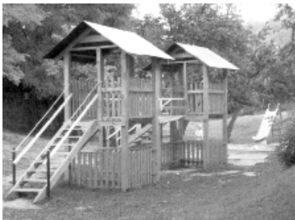
Detský hrad Jablonec