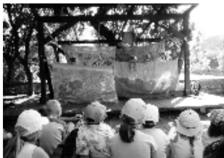
Detský letný tábor, Svätý Jur 2004